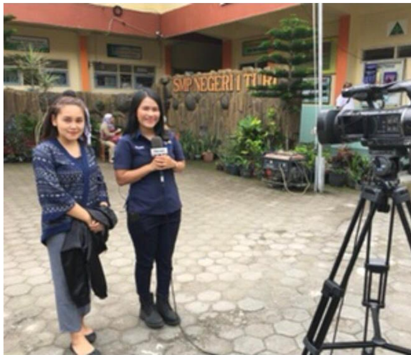
Gambar 2. Liputan di SMPN 1 Turi