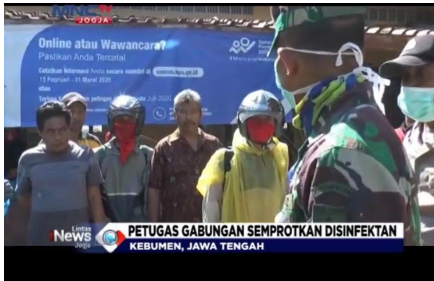
Gambar 8. Berita yang telah dibacakan oleh penulis di channel Youtube iNews Yogyakarta