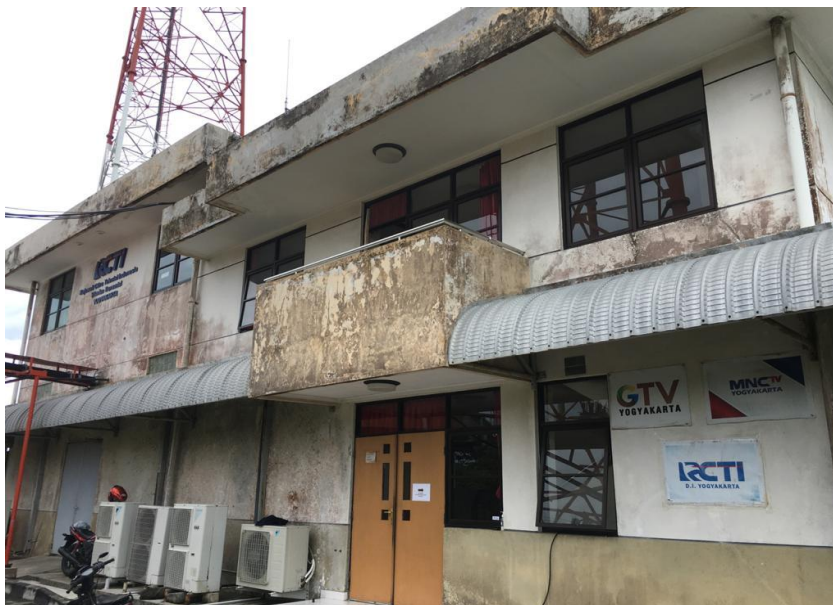
Gambar 11. Pemancar MNC GROUP di Pathuk, Gunung Kidul