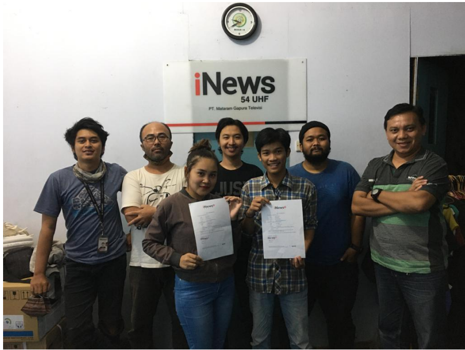
Gambar 15. Foto bersama crew Lintas iNews Yogyakarta