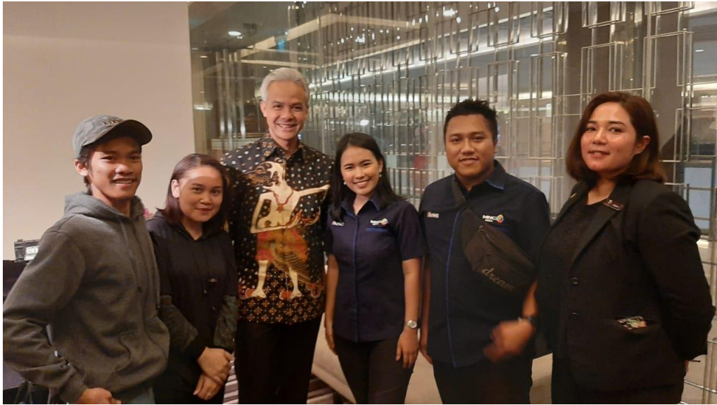
Gambar 1. Liputan di Semarang bersama Tim Live iNews Yogyakarta