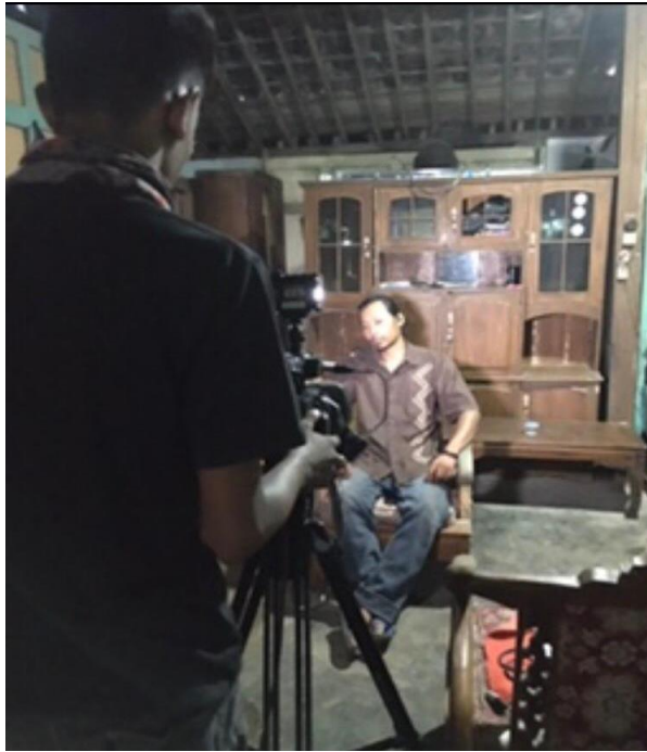
Gambar 3. Liputan di Turi