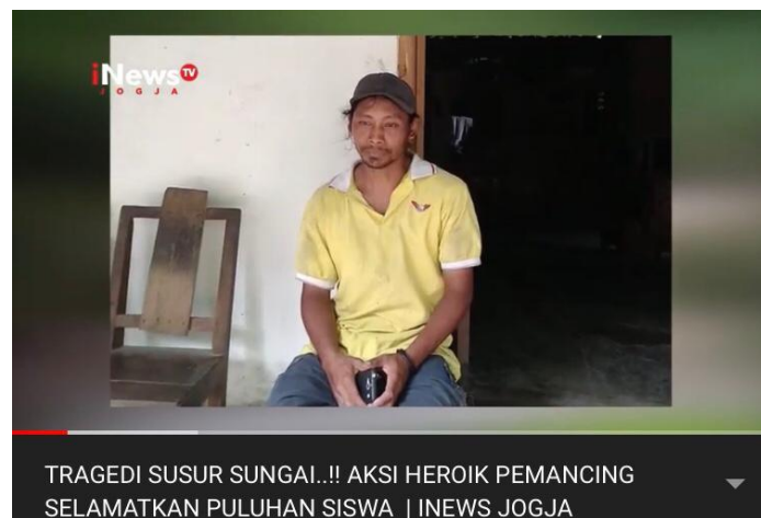
Gambar 7. Berita yang sudah dibacakan oleh penulis di channel Youtube iNews