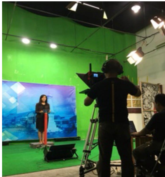
Gambar 4. Tapping Program Lintas iNews Yogyakarta