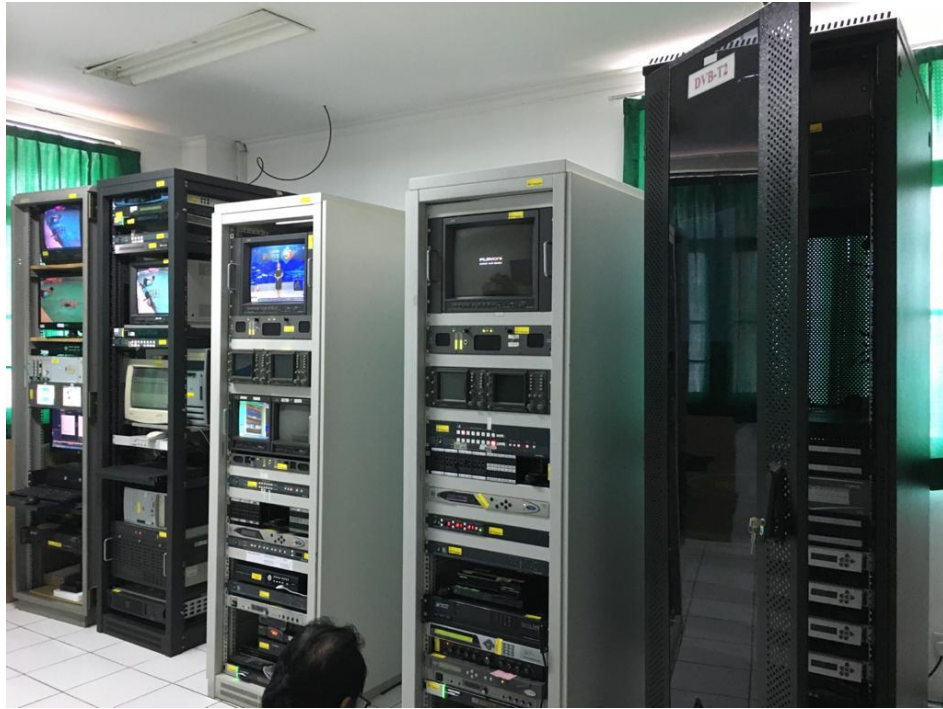
Gambar 9. Master Control Room Televisi