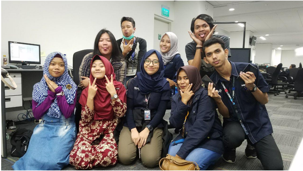
Foto bersama tim administrasi audisi Kilau DMD