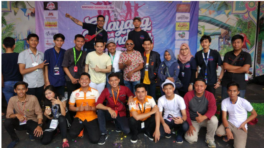
Foto bersama panitia Selayang Pandang Bintang Dangdut 2018