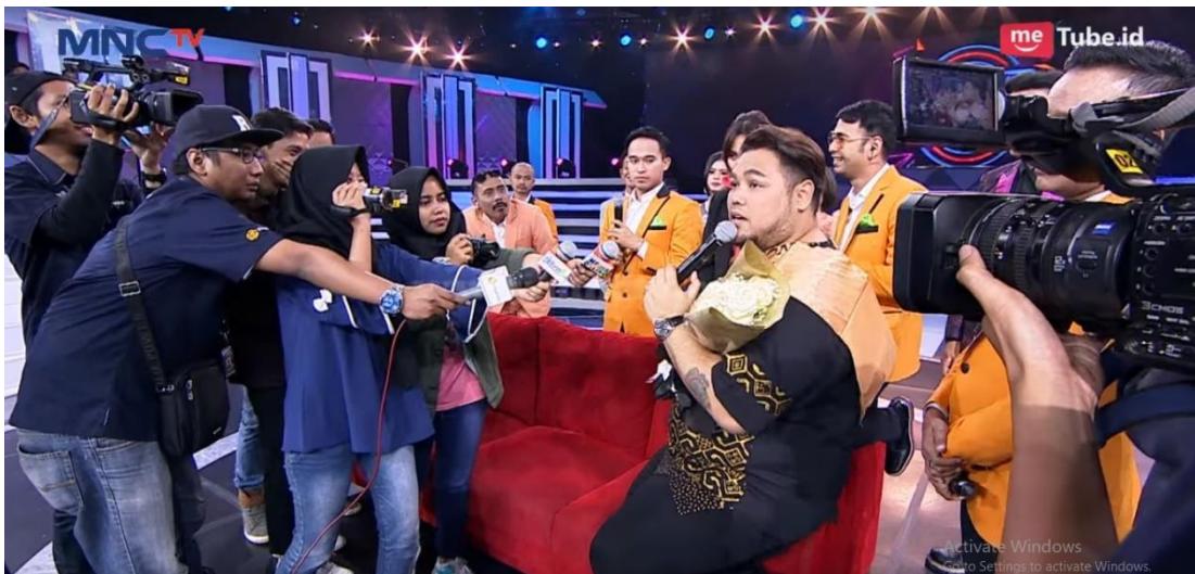
Saat menjadi ekstras talen dalam Konferensi Pers penobatan gelar kepada Ivan Gunawan