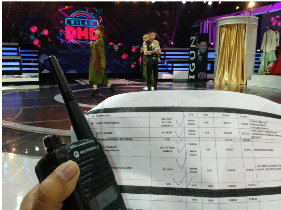
Saat bertugas briefing peserta dan juri sekaligus memegang matador tulis