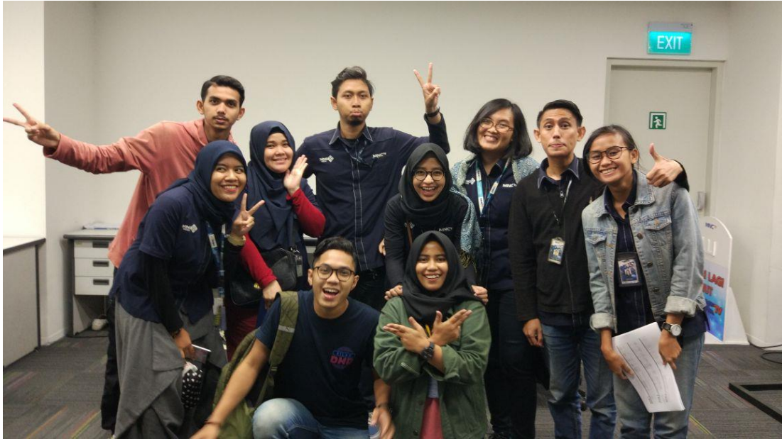
Foto bersama Divisi Kreatif MNC TV