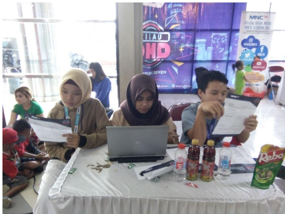
Administrasi Audisi DMD di Trade Mall Bogor