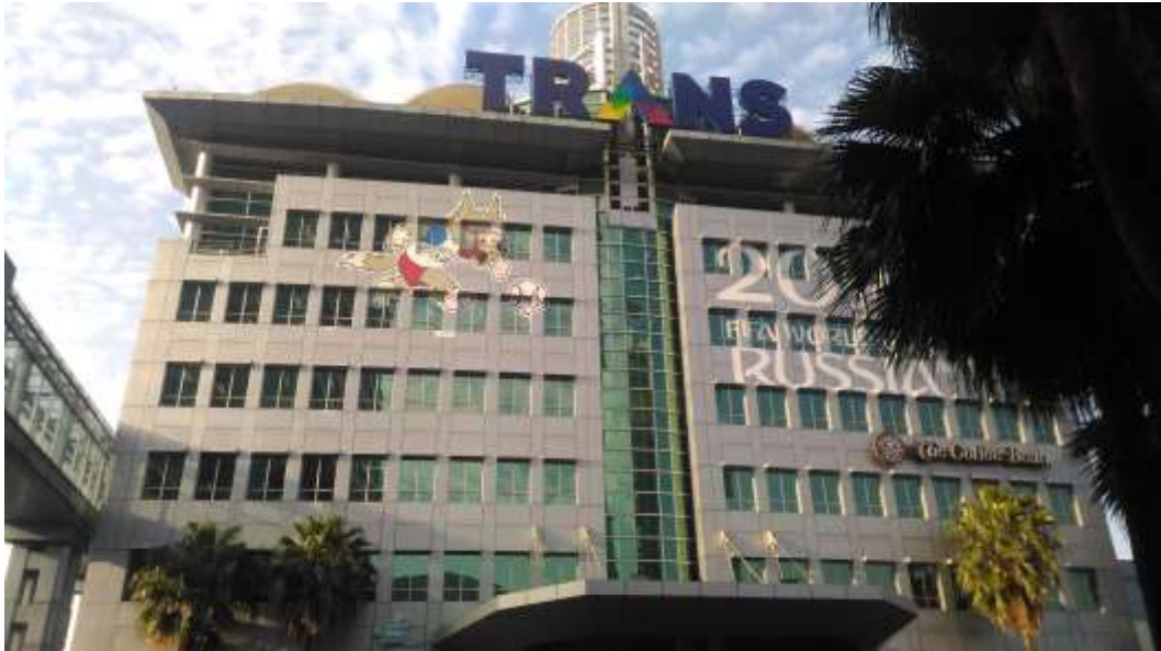
Gambar 9. Gedung TRANSMEDIA