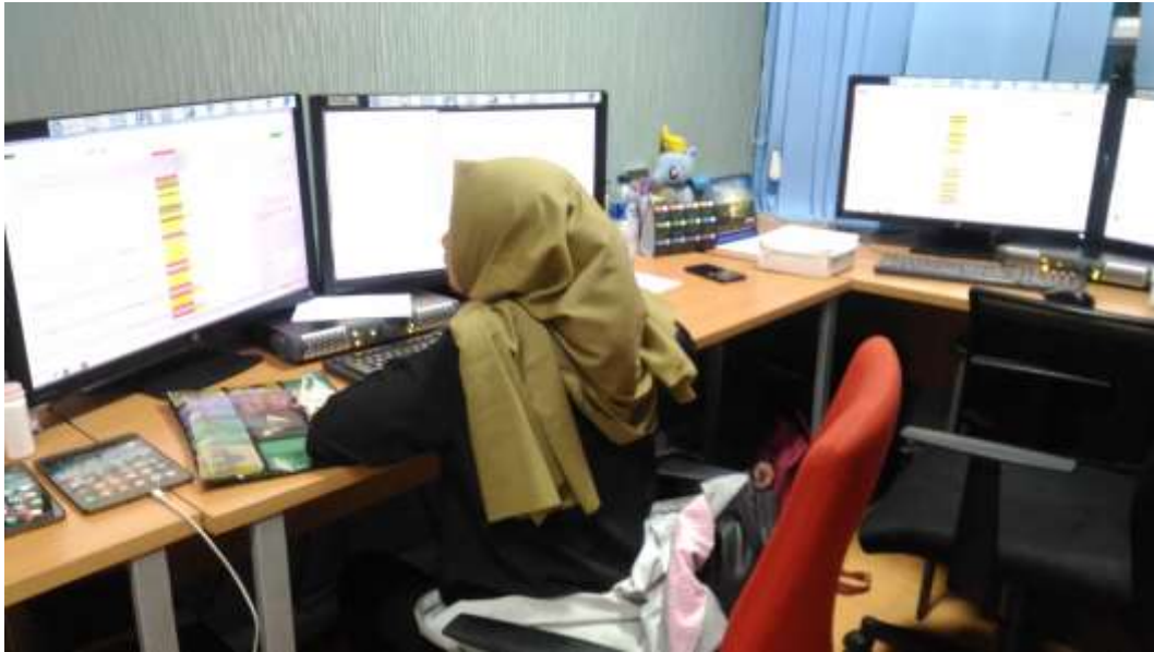
Gambar 1. Penulis menghimpun gambar sesuai pada rundown .