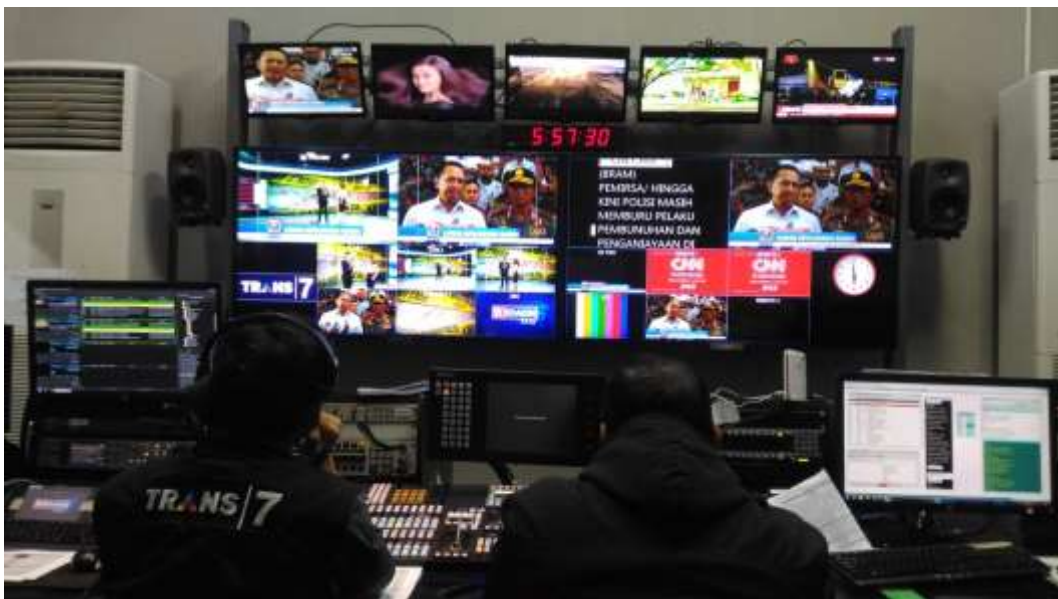
Gambar 4. Proses ON AIR di Ruang Master Control Room Video Studio 7