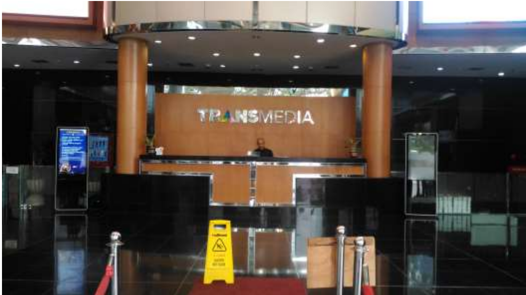
Gambar 11. Lobi TRANS MEDIA