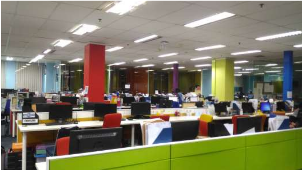
Gambar 3. News Room Lantai 5 TRANS MEDIA