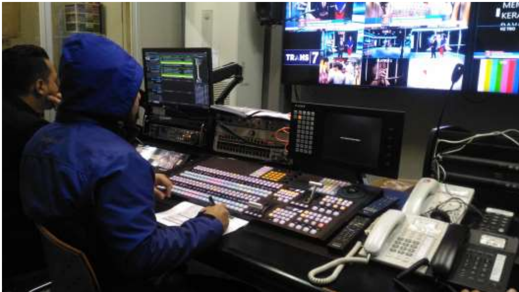
Gambar 5. Proses ON AIR di Ruang Master Control Room Video Studio 7