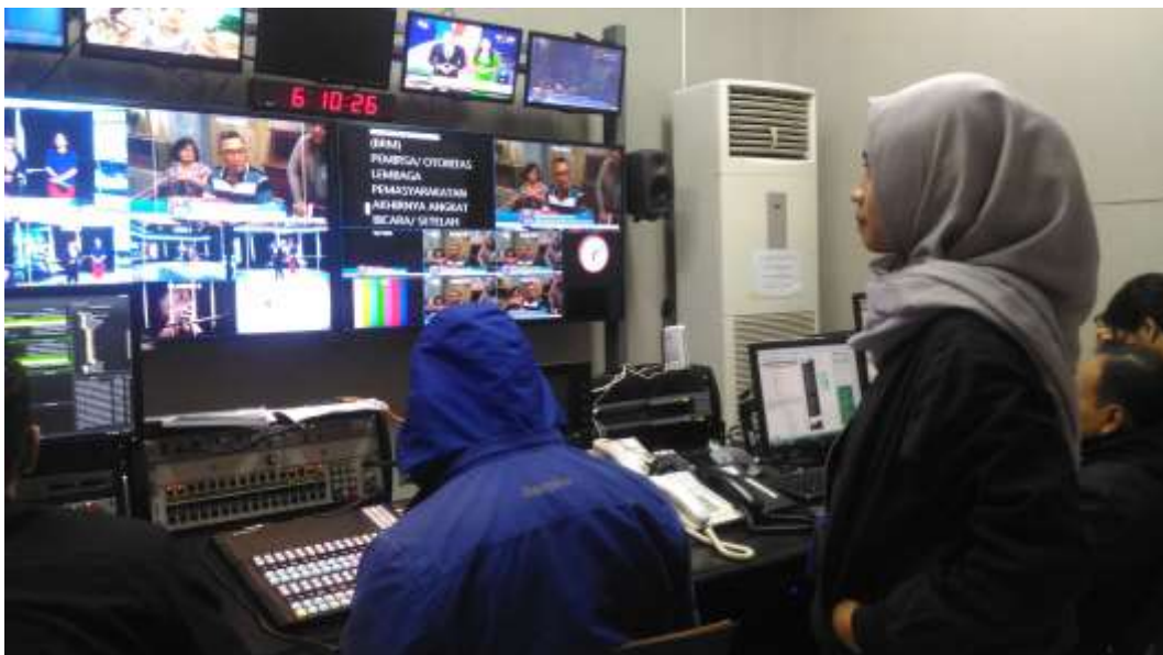
Gambar 6. Proses ON AIR di Ruang Master Control Room Video Studio 7