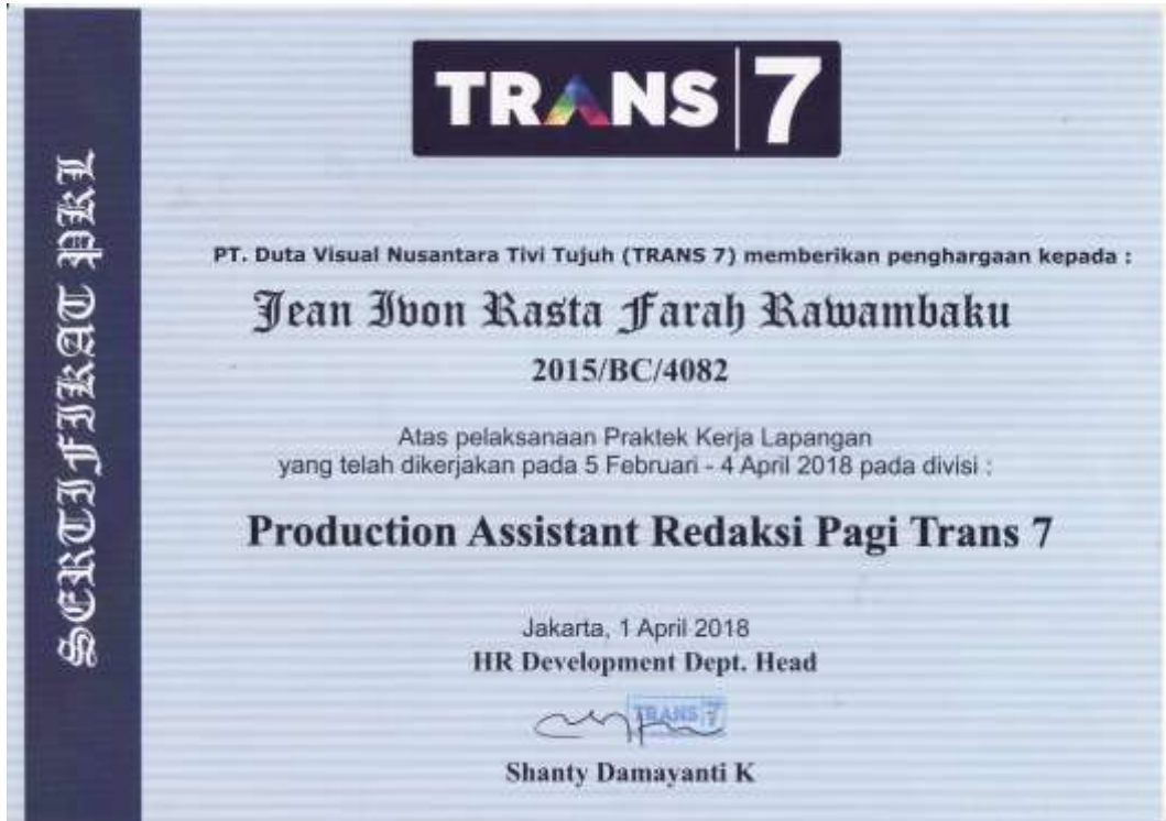
Gambar 18. Sertifikat Magang