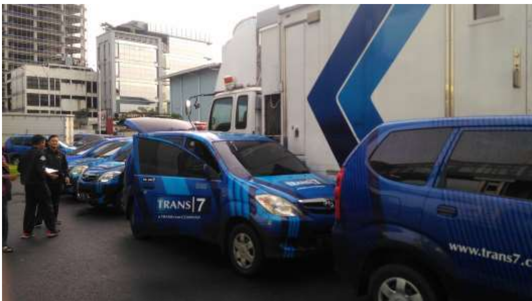
Gambar 10. Carpool (Parkiran Mobil TRANS 7)