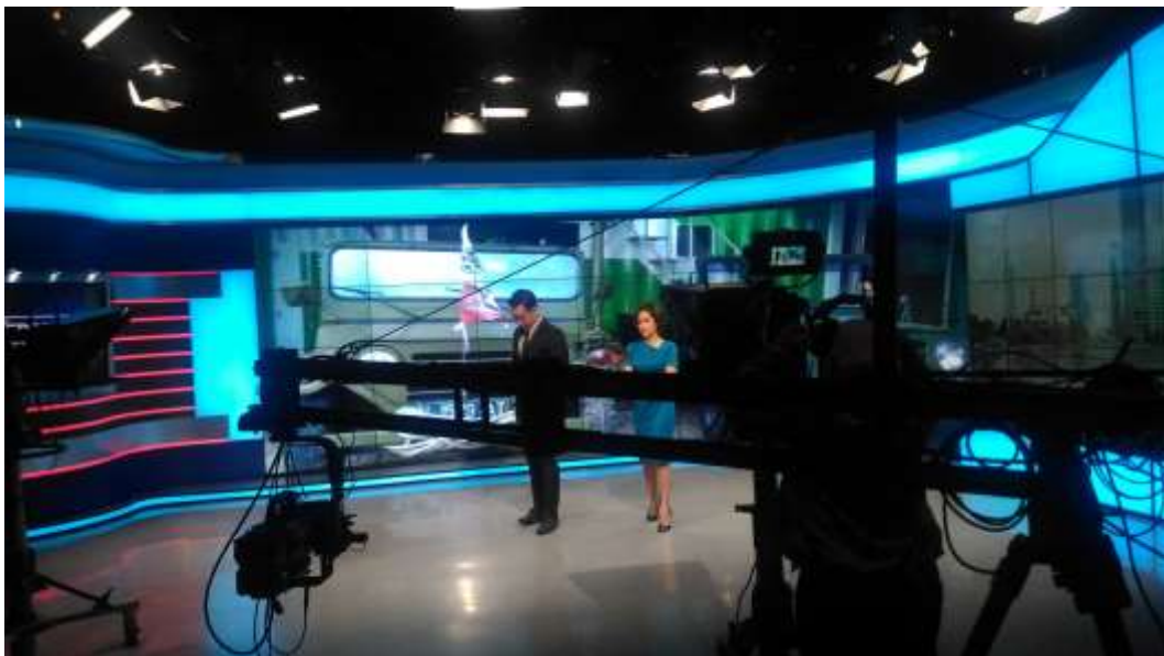
Gambar 12. Studio 7 TRANS 7