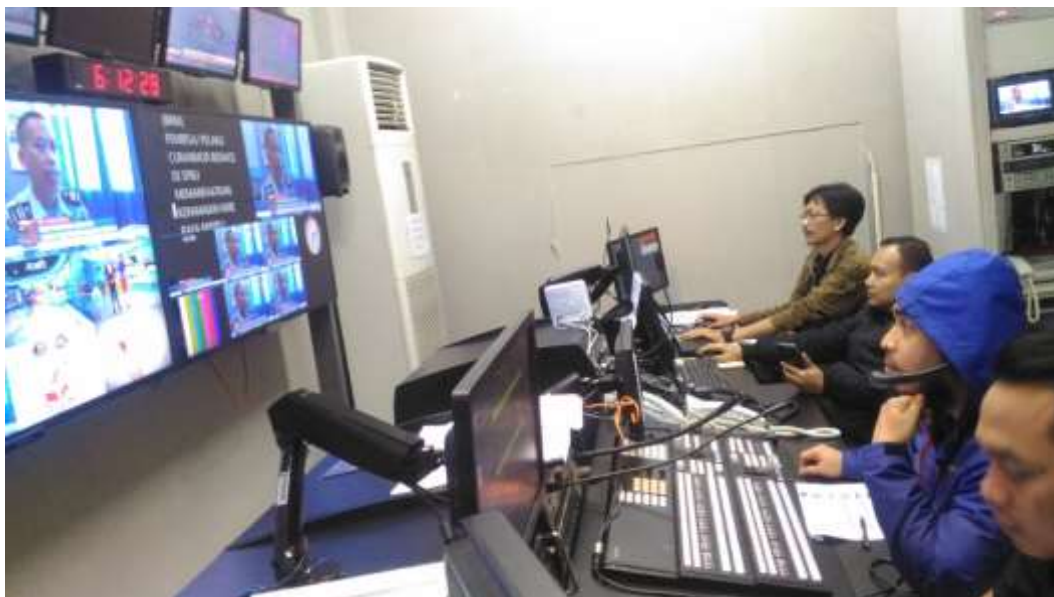
Gambar 7. Proses ON AIR di Ruang Master Control Room Video Studio 7