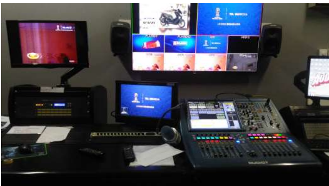
Gambar 8. Ruang Master Control Room Audio Studio 7