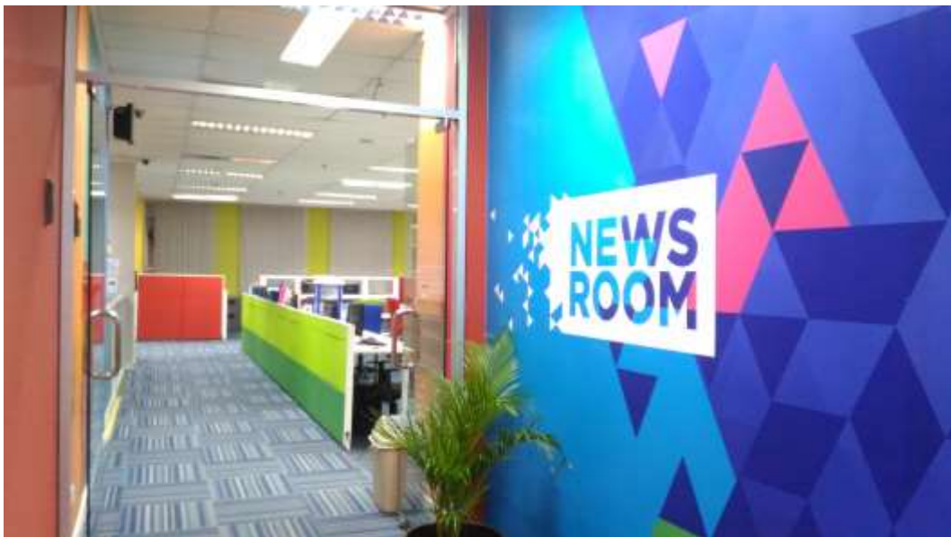
Gambar 2 Pintu Masuk News Room Lantai 5 TRANS MEDIA