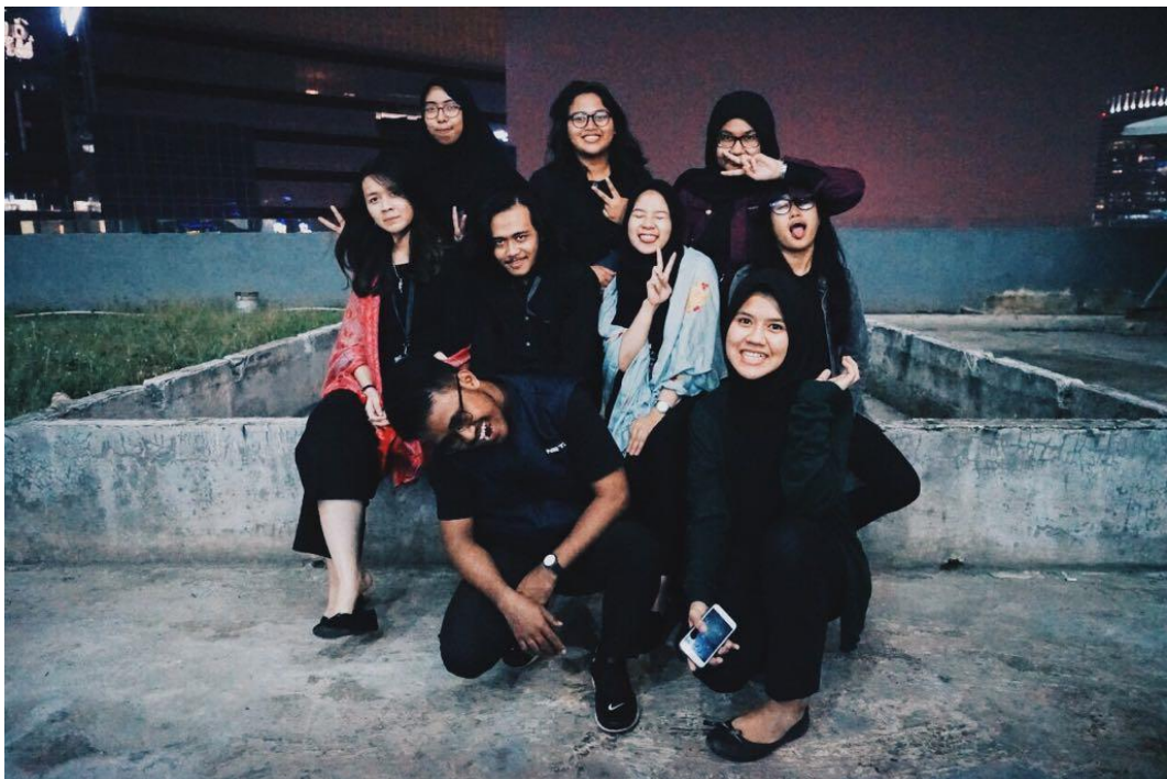
Foto penulis bersama anak magang NET. Jakarta.