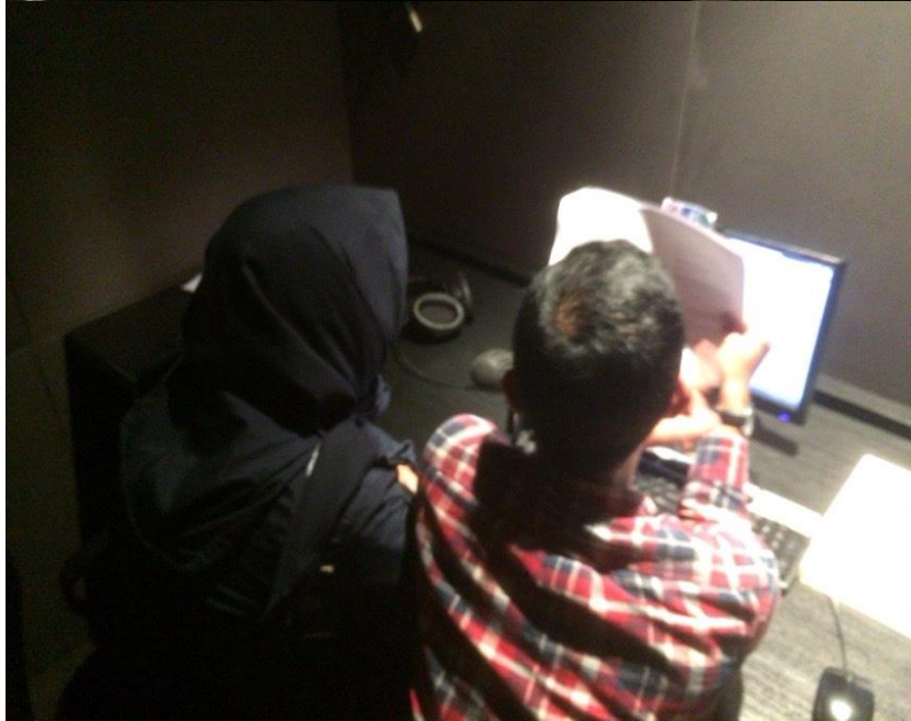
Foto saat sedang mendampingi take voiceover bersama narator.