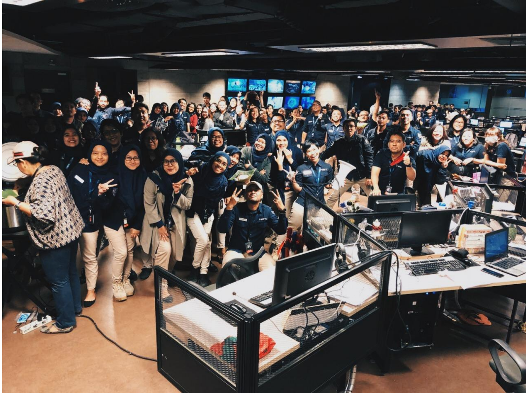
Foto bersama seluruh crew NET. Jakarta.