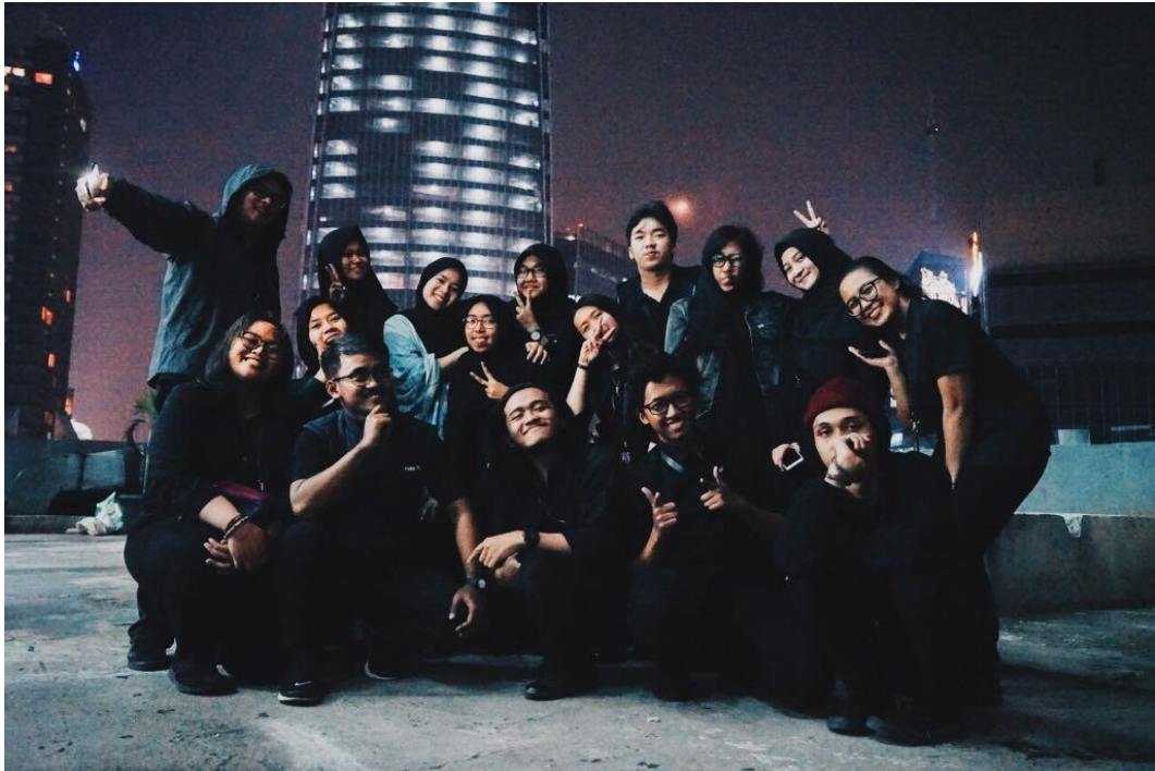
Foto penulis bersama anak magang NET. Jakarta.