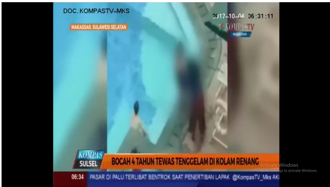
Lampiran XV : CG KOMPAS SULSEL