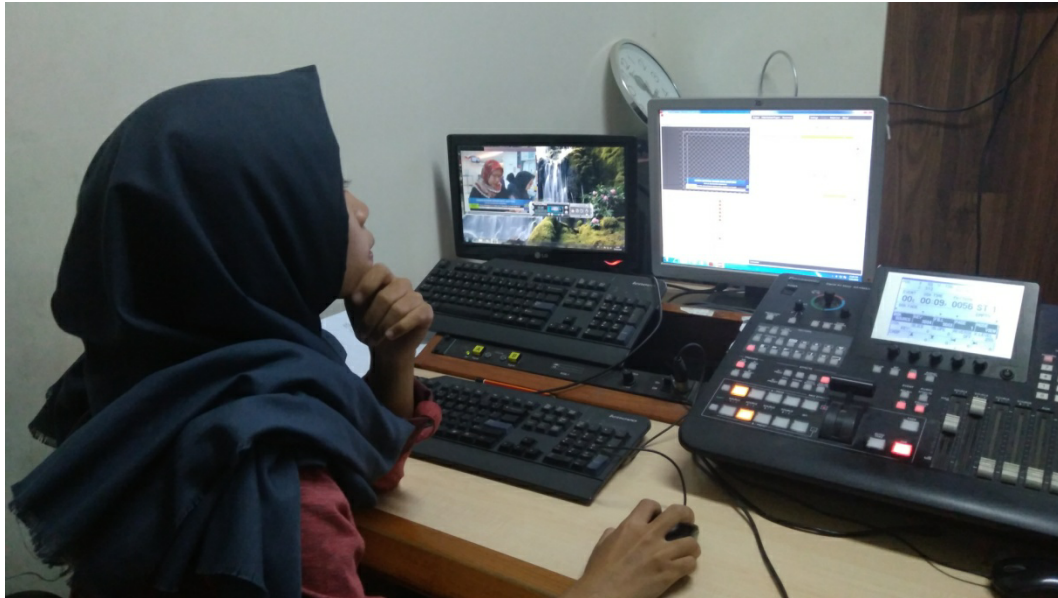
Gambar 1.5 Asisten Produser memegang CG ( Character Generic )