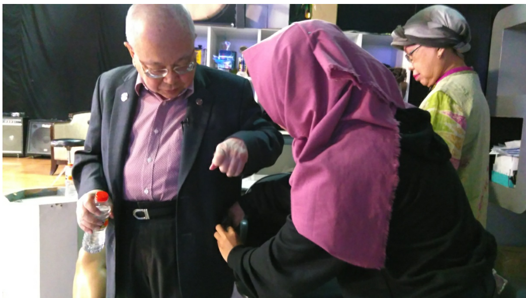
Gambar 1.6 Asisten Produser membantu memasang Clip on kepada narasumber