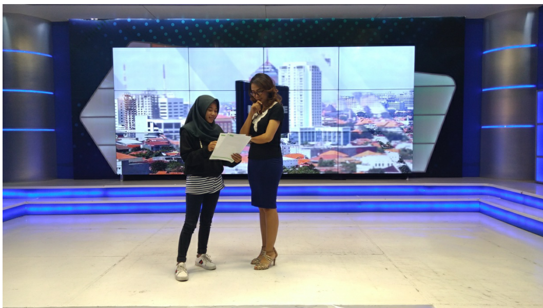
Gambar 1.8 Asisten Produser saat mem-briefing anchor sebelum produksi dimulai