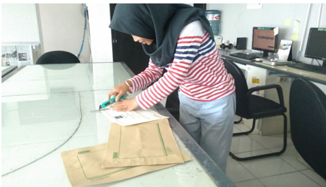
Gambar 1.4 Proses Asisten Produser Membuat Sertifikat Narasumber Update Cantik