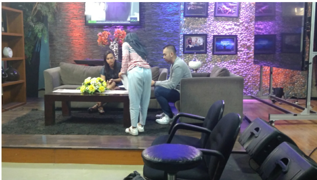
Gambar 1.3 Proses Asisten Produser briefing materi dan durasi dengan host Update Cantik