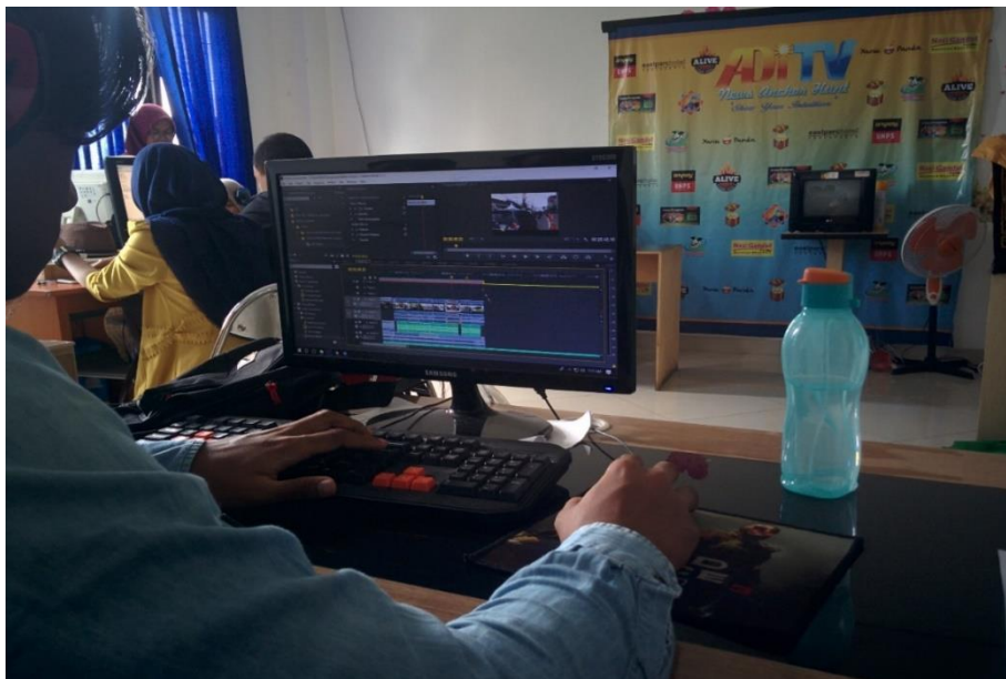
Gambar 1.4 Melihat proses editing