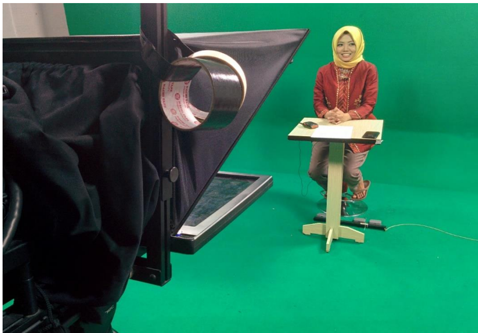
Gambar 1.2 Proses taping lensa 44 malam