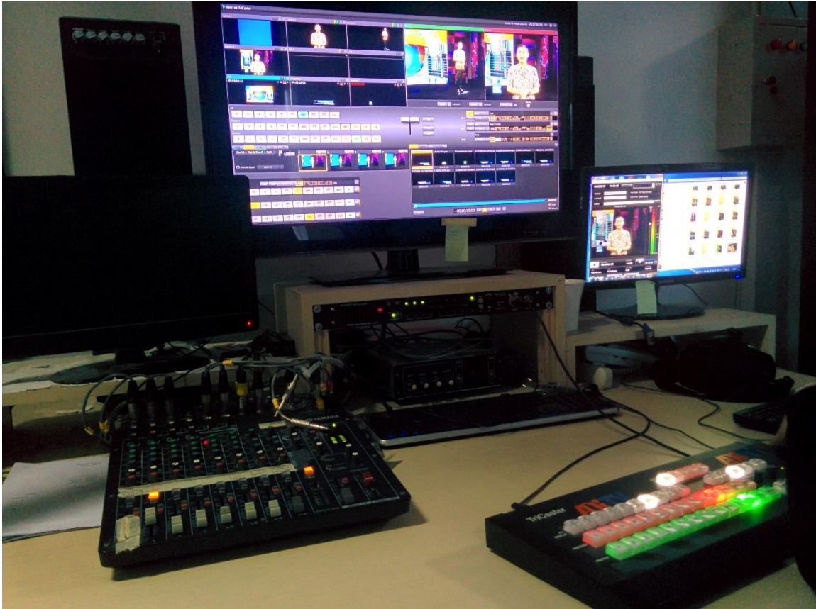
Gambar 1.5 Master control room yang melakukan live lensa 44 siang Pukul 13:00