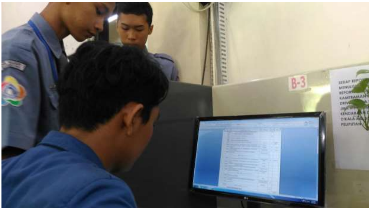
Membantu koreksi naskah