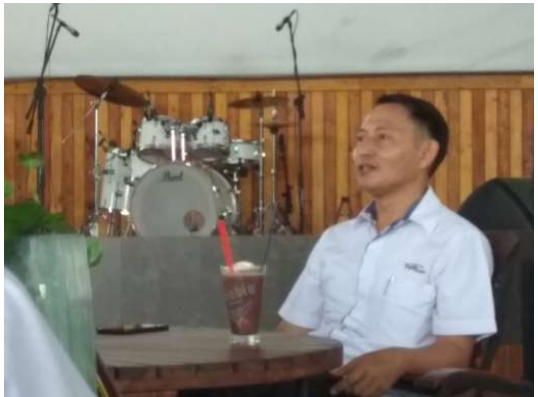
Ketika mengikuti perpisahan KABID Pemberitaan