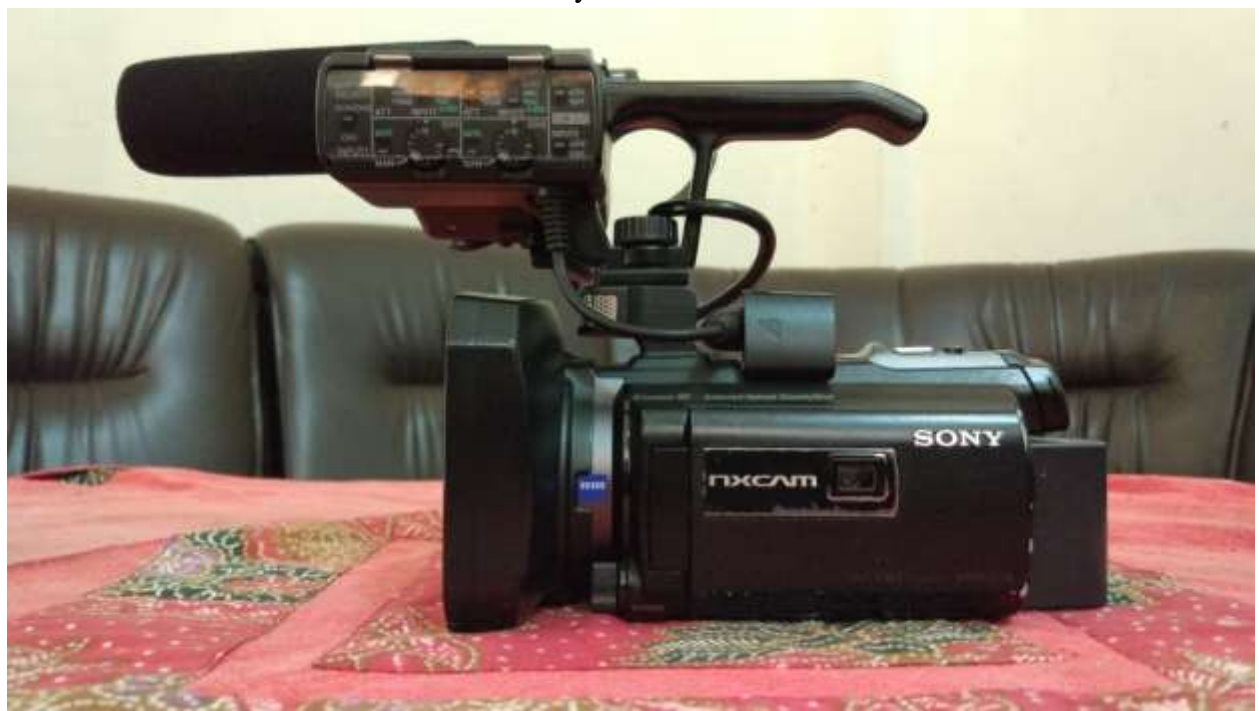
satu Kamera yang ada di TVRI