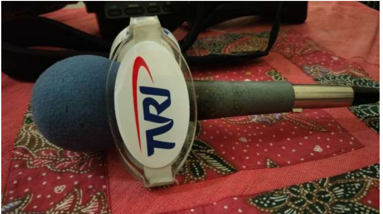
Microfon Merk Sure