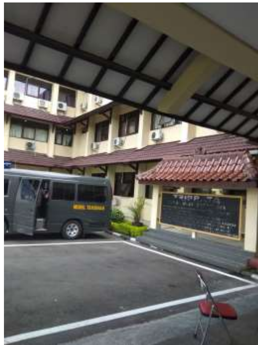
Saat melakukan peliputan Skimming