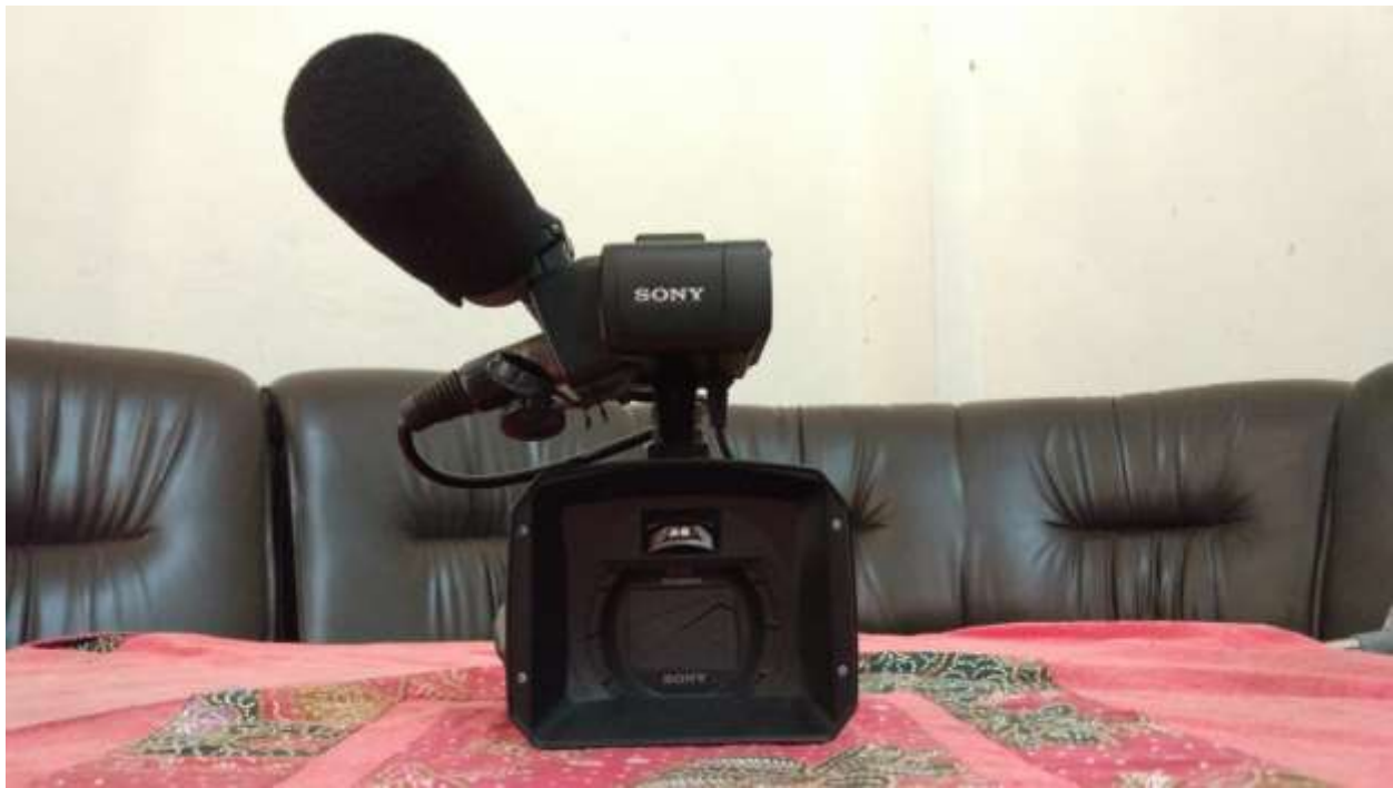
Kamera sony NX