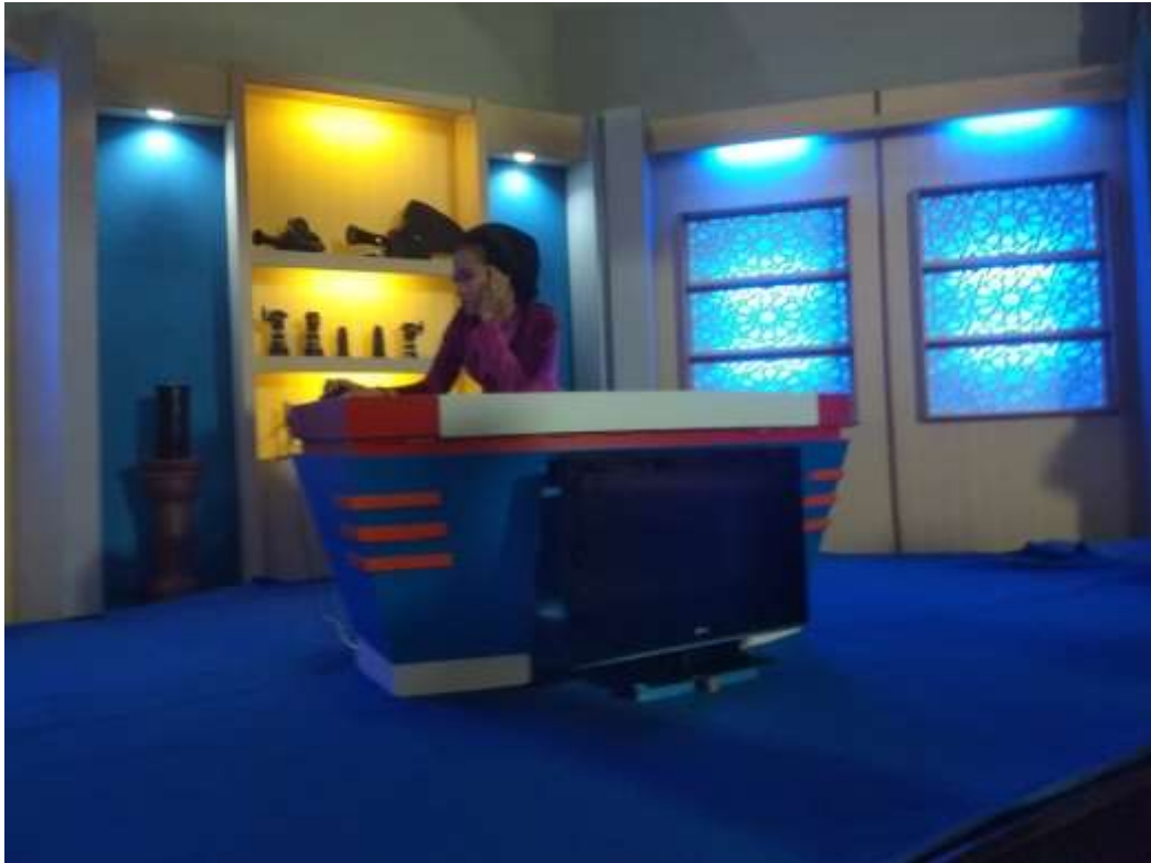
Studio Jogja Dalam Berita