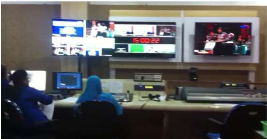
Ruang Master Control