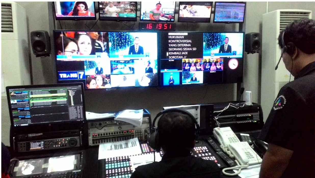
Proses Produksi Program Redaksi Sore di Ruang Control Room