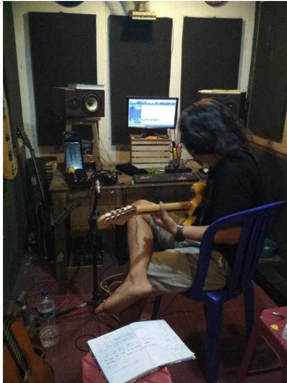
Proses rekaman lagu

Proses pembuatan lagu ini dilaksanakan distudio AG Record dengan menggunakan software Nuendo 8 , Disini saya selaku editor juga berperan untuk membuat lagu/ soundtrack dengan judul Rindu ibu .