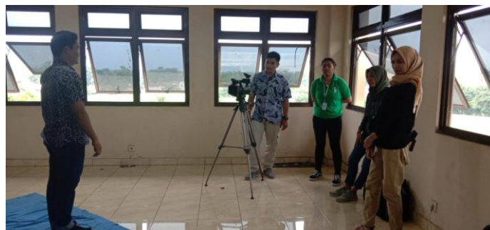
Penulis bertugas menentukan komposisi pada objek yang akan diambil gambarnya.