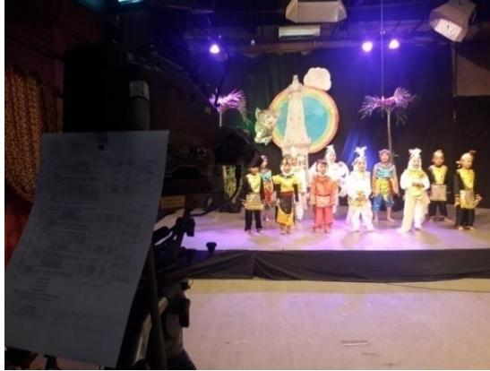
Suasana panggung yang berada di studio 1 pada program ceria anak di jogja tv.