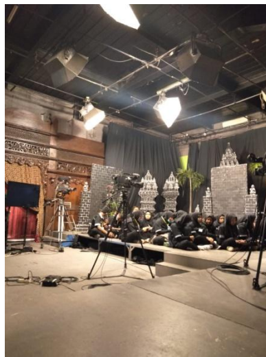
Suasana studio saat ada kunjungan dari sekolah – sekolah pada program jogja music nation di jogja tv.