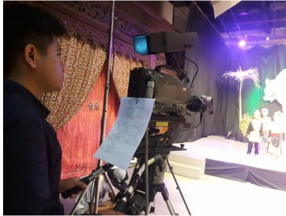
Penulis bertugas sebagai kameraman pada program ceria anak yang berada di studio 1 di jogja tv.