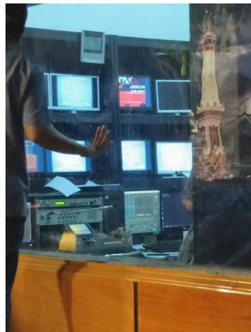
Keadaan ruang master control saat produksi berlangsung yang berdekatan dengan studio 1. Terlihat pengarah acara sedang mengecek hasil gambar dari kamera.