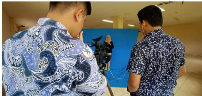
Penulis bertugas sebagai kameraman pada program potret muslimah di Jogja Broadcasting Class.