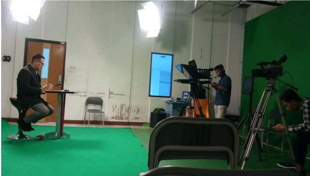
Kegiatan Produksi Program Berita Lensa 44 di Studio