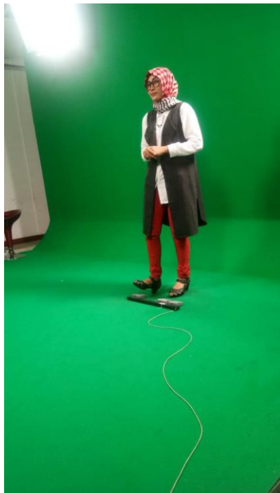
Kegiatan Produksi di MCR