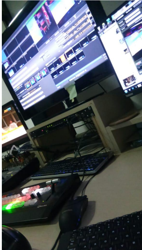
Kegiatan Produksi di MCR