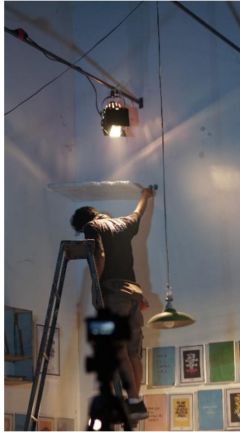
Pemasangan lighting effect