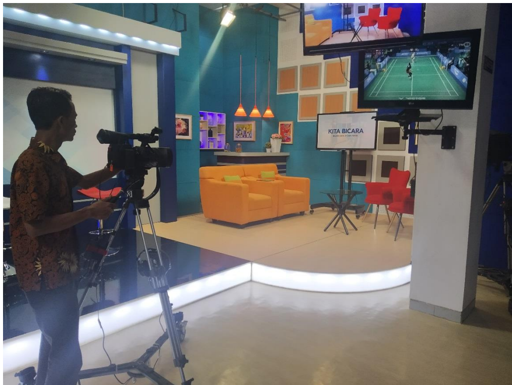
DEKOR PROGRAM ACARA KITA BICARA