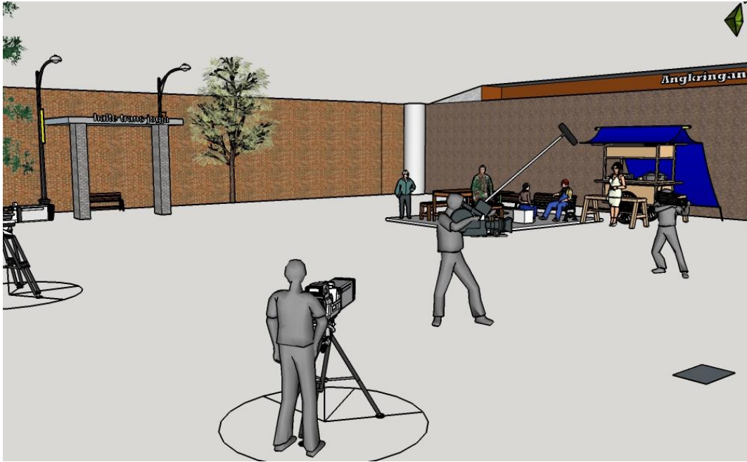
TUGAS DARI DIVISI TATA ARTISITIK