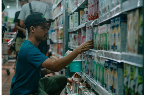
Gambar 39. Team Artistik Sedang Persiapan Take dengan menata ulang agar Merk tidak terlihat di Mirota kampus