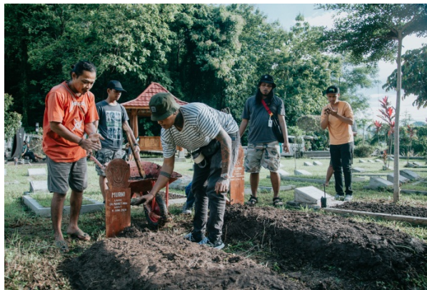
Gambar 37. Team Artistik Sedang Persiapan Take di Pemakaman Umum Pemda Sleman