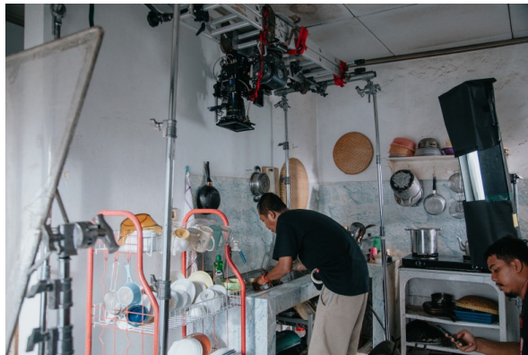
Gambar 41. Team Artistik Sedang Persiapan Take dapur di rumah Siti