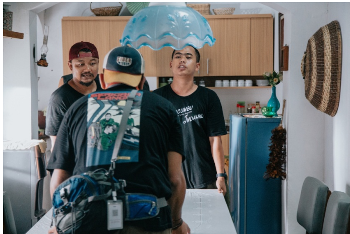
Gambar 38. Team Artistik Sedang Persiapan Take di Ruang Makan (Rumah Siti)