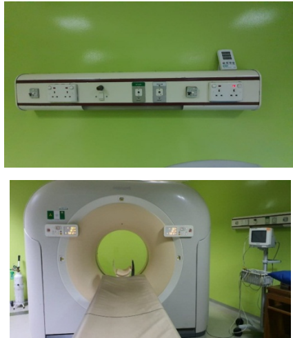
Gambar 28. Sutradara,Dop, Artistik Sedang Recce untuk Scan bagian halaman depan kost bagas