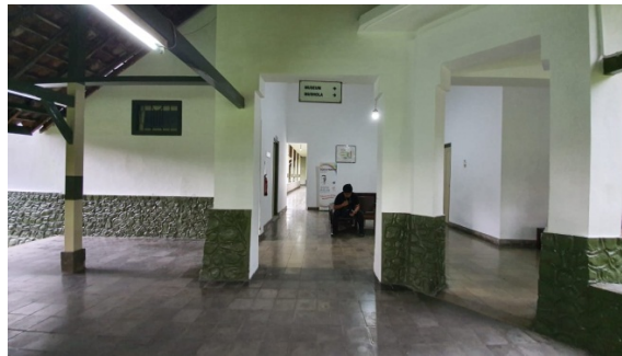
Gambar 29. Sutradara,Dop, Artistik Sedang Recce untuk Rumah Sakit Jiwa