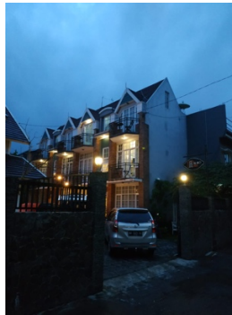
Gambar 26. Sutradara,Dop, Artistik Sedang Recce untuk Kost Bagas bagian halaman depan kost bagas