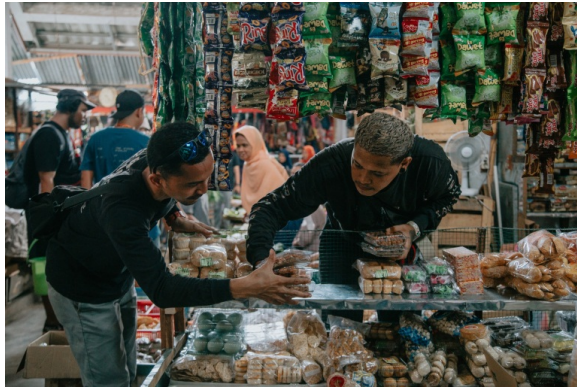
Gambar 40. Team Artistik Sedang Persiapan Take dengan menata ulang agar Merk tidak terlihat di Pasar Bantul