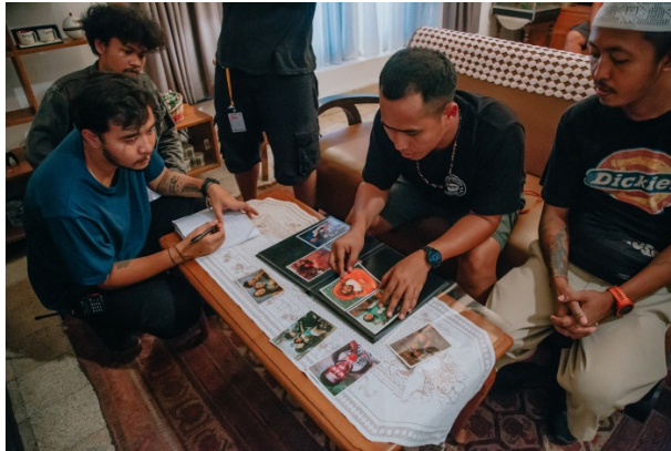
Gambar 42. Team Artistik Sedang Persiapan Take membuka albumk foto keluarga Sasongko