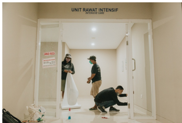
Gambar 43. Team Artistik Sedang Persiapan Take Lorong depan UGD di Rumah Sakit Bantul