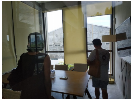
Gambar 33. Sutradara,Dop, Artistik Sedang Recce Angkopologi untuk Ruang