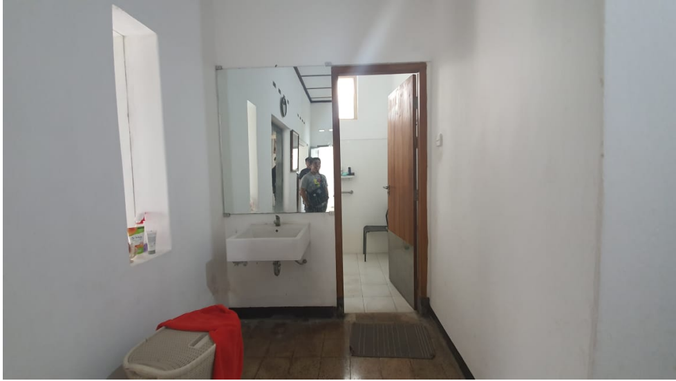
Gambar 23. Sutradara,Dop, Artistik Sedang Recce untuk Rumah Siti bagian Kamar Mandi