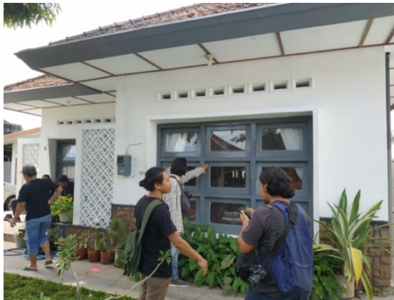
Gambar 17. Sutradara dan Dop Sedang Recce untuk Rumah Siti