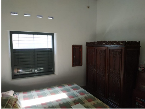
Gambar 18. Sutradara,Dop dan Artistik Sedang Recce untuk Rumah Siti bagian kamar Jalu Sutradara dan Dop Sedang Recce untuk Rumah Siti