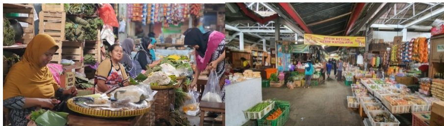
Gambar 30. Sutradara,Dop, Artistik Sedang Recce Pasar Bantul untuk Pasar