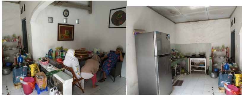
Gambar 21. Sutradara,Dop, Artistik Sedang Recce untuk Rumah Siti bagian Dapur