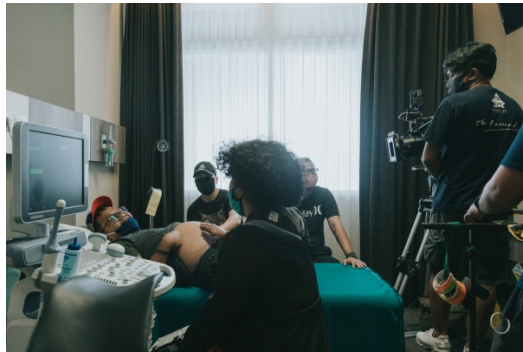
Gambar 36. Sutradara,Dop, Team Artistik Sedang Persiapan Take di Ruang USG