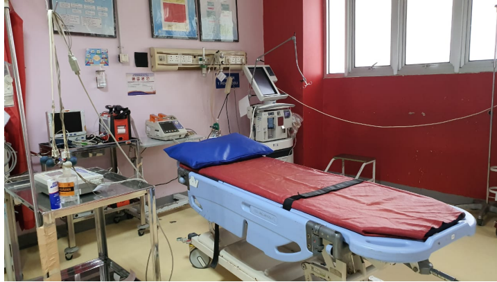
Gambar 31. Sutradara,Dop, Artistik Sedang Recce RS UGM untuk Ruang Operasi