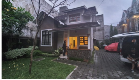
Gambar 25. Sutradara,Dop, Artistik Sedang Recce untuk Rumah Pratiwi bagian halaman Depan Rumah Pratiwi