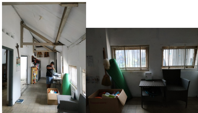
Gambar 20. Sutradara,Dop, Artistik Sedang Recce untuk Rumah Siti bagian Ruang Makan