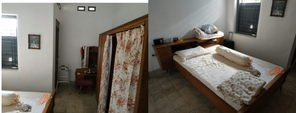
Gambar 19. Sutradara,Dop, Artistik Sedang Recce untuk Rumah Siti bagian kamar marni