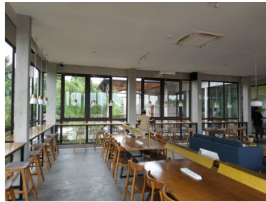
Gambar 32. Sutradara,Dop, Artistik Sedang Recce Angkopologi untuk Kantin