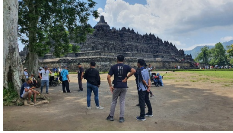
Gambar 34. Sutradara,Dop, Artistik Sedang Recce di Borobudur untuk Tempat Piknik