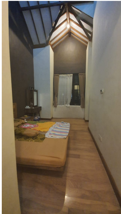
Gambar 24. Sutradara,Dop, Artistik Sedang Recce untuk Rumah Pratiwi bagian Kamar Keluarga Pratiwi