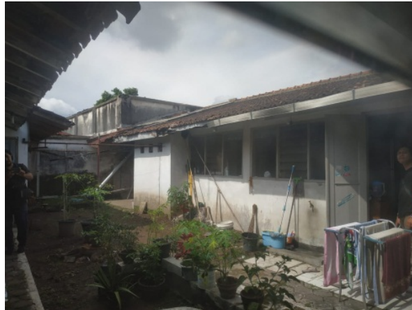
Gambar 22. Sutradara,Dop, Artistik Sedang Recce untuk Rumah Siti bagian Halaman Belakang