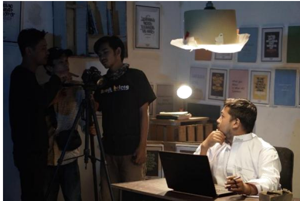
Proses pengambilan gambar