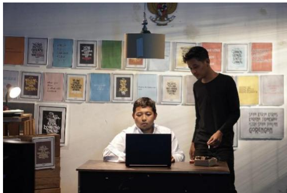
Brefing sutradara kepada talent