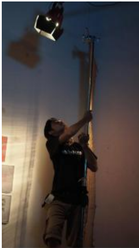
Proses pemasangan lighting