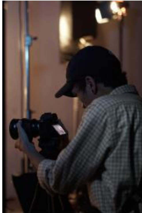
Proses pengambilan gambar