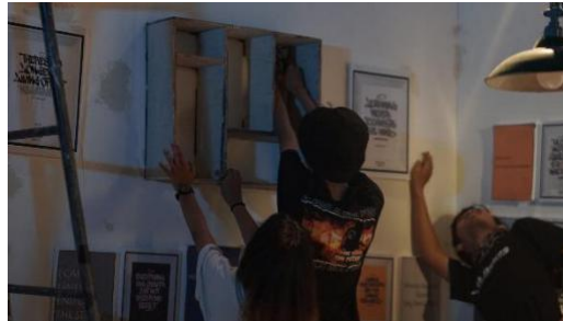
PROSES PEMASANGAN ARISTIK