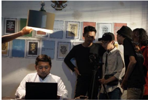
Proses pengambilan gambar