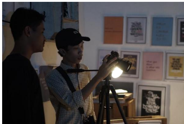
Proses pengambilan gambar