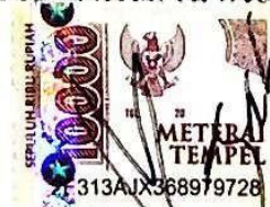
Galuh Megawati Saputri