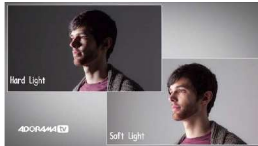
Gambar 25. Contoh hard light dan soft light

Soft Light adalah sebaliknya; cahaya yang hanya menampilkan bayangan kabur, tidak jelas; terkadang tidak ada bayangan sama sekali. (Christopher 2009:82)