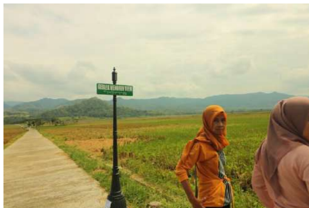
Gambar 9. sawa tempat untuk berfoto