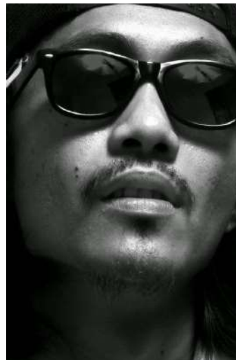
Gambar 30. Top Light

Sebagian besar sumber cahaya di dunia nyata, dan kemudian di dunia film, datang dari atas dan sedikit menjauh. Ini umumnya berlaku karena cahaya yang datang langsung dari atas. (Christopher 2009:89)