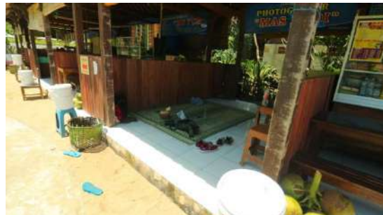
Gambar 2. Warung makan di pantai ngrawe