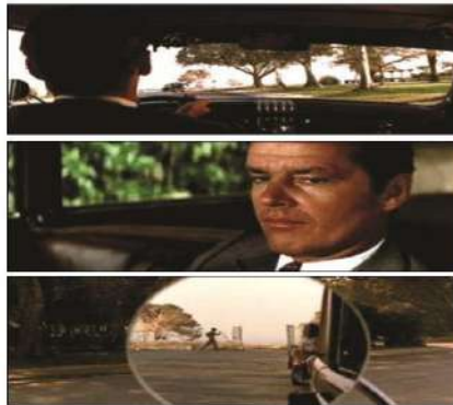
Gambar 12. Angle Kamera Poin Of View

Angle kamera Point Of View , atau disingkat P.O.V, merekam adegan dari titik pandangan pemain tertentu. P.O.V adalah angle objektif, tapi karena ia berada antara objektif dan subjektif, maka angle ini harus ditempatkan pada kategori yang terpisah dan diberikan ketimbangan khusus. (Mascelli, 2010:22)