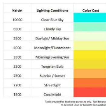
Gambar 33. Temperatur warna

Temperatur warna, sepanjang skala derajat Kelvin, membantu kita memahami apa warna cahaya yang tak terlihat itu. Ini diukur dalam ribuan derajat (sekitar 1.000 hingga 20.000 derajat Kelvin). Tanpa mempelajari semua sains di baliknya, Anda hanya perlu memahami bahwa ada dua warna utama yang menjadi perhatian di sepanjang skala Kelvin untuk pemotretan film dan video: kemerahan dan biru. Angka-angka yang paling umum dikaitkan dengan suhu warnanya masing-masing adalah 3200 dan 5600 derajat Kelvin. Lampu film umumnya memancarkan cahaya Kelvin 3200 derajat, dan siang hari (dari matahari) kira-kira sekitar 5.600 derajat Kelvin. Semakin rendah jumlah derajat Kelvin (0 – 4000-ish), semakin kemerahan, atau “lebih hangat,” cahayanya. Semakin tinggi jumlah derajat Kelvin (4000 – 10.000 ke atas), semakin biru, atau “lebih dingin,” cahaya akan muncul. (Christopher 2009 : 77)