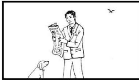
Medium Long Shot : MLS

Shot pertama dalam peningkatan besaran yang memotong bagian tubuh subjek -secara tradisional dibingkai sedemikian sehingga bagian bawah bingkai memotong kaki baik di bawah atau, lebih umum, tepat di atas lutut. Pilihan untuk memotong di mana mungkin tergantung pada kostum atau gerakan tubuh individu dalam shot . (Christopher 2009:15)