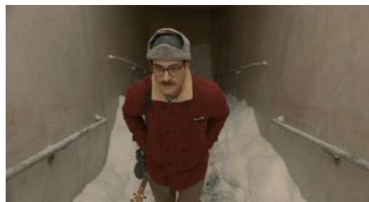
Gambar 13. High Angel

Shot yang diambil dengan high angle adalah segala macam shot dimana mata mata kamera diarahkan kebawah untuk menangkap subjek. (Mascelli. 2010 : 54)