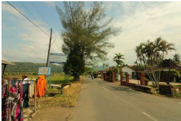
Gambar 8. Jalan Kampung