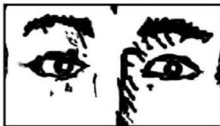
Extreme Close-Up : XCU / ECU

Framing mendukung satu aspek dari subjek seperti matanya, mulut, telinga, atau tangan. Kurangnya titik referensi ke lingkungan sekitarnya, audiens tidak memiliki konteks di mana untuk menempatkan bagian tubuh ini detail, sehingga pemahaman akan berasal dari bagaimana atau kapan shot ini diedit ke dalam gambar-itulah mungkin membantu jika subjek yang detail tubuhnya ditampilkan dalam XCU pertama ditampilkan dalam gambar yang lebih luas sehingga konteks dapat ditetapkan untuk penonton. (Christopher 2009:19)