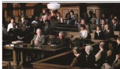
Gambar 11. Angle Kamera Objektif

Kamera objektif melakukan penembakan dari garis sisi titik pandang. Penonton menyaksikan peristiwa dilihatnya melalui mata pengamat yang tersembunyi, seperti mata seseorang yang mencuri pandang. Juru kamera dan sutradara seringkali dalam menata kamera objektifnyamenggunakan titik pandang penonton. Karena peristiwa yang mereka sajikan di layar putih bukan dari sudut pandang siapapun yang berada dalam adegan film, maka angle dari kamera objektif tidak mewakili siapapun. Orang yang difilm kan akan nampak tidak menyadari adanya kamera dan tidak pernah memandang ke arah lensa, biarpun hanya dengan lirikan sekilas, adegan harus diulang pengambilannya. Sebagian besar adegan film disajikan dari angle kamera yang objektif. (Mascelli, 2010:5).