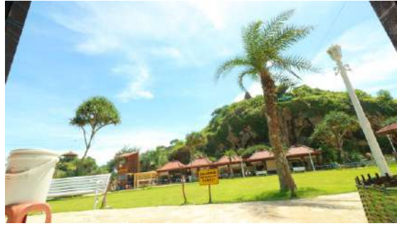
Gambar 3. Taman pantai ngrawe