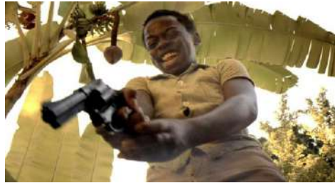
Gambar 16. Angle plus angle

Shot Angle-plus-angle merupakan pengambilan gambar dengan kamera yang penataan angle -nya adalah dalam hubungan dengan subjeknya, sementara kamera itu juga dimiringkan menunduk/mengadah. ( Mascelli, 2010:76)