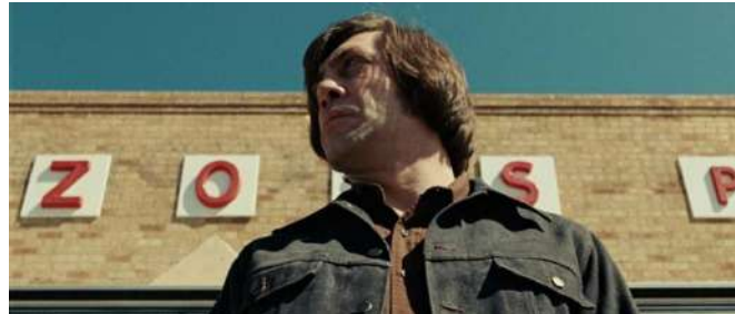
Gambar 14. Low angle

Shot low angle adalah setiap shot dimana kamera menghadah ke atas dalam merekam objek (Mascelli. 2010 : 63)