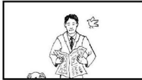
Medium Shot : MS

Bisa juga disebut shot “Pinggang”, karena bingkai memotong gambar manusia tepat di bawah pinggang dan tepat di atas pergelangan tangan jika lengan. (Christopher, 2009:16)