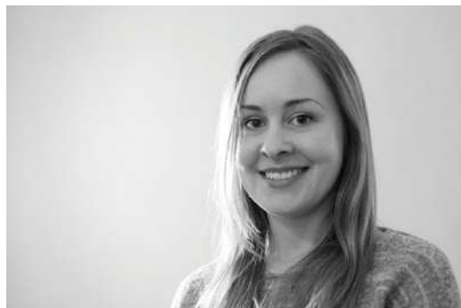
Gambar 28 Side Light

Jika kita melanjutkan jalan kita di sekitar aktor dan menempatkan cahaya 90 derajat di sekitar lingkaran dari kamera ke sumbu subjek, itu disebut side light dan dapat menghasilkan belahan wajah setengah gelap setengah terang sepanjang batas hidung. (Christopher 2009:88)