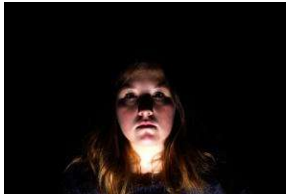
Gambar 31. Under Light

Sebaliknya, jika Anda menyalakan dari bawah, Anda menciptakan efek pencahayaan yang agak tidak wajar, karena sangat sedikit lampu yang benar-benar ada di bawah tingkat kepala kita dalam kehidupan sehari-hari. (Christopher 2009:89)