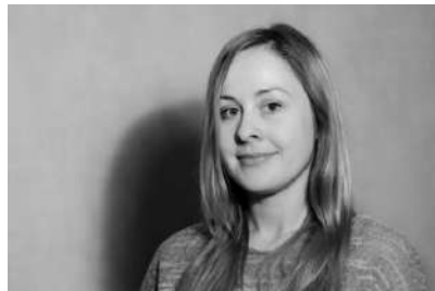
Gambar 27. Front Light

Seperti yang Anda ketahui bahwa kamera dapat ditempatkan di sekitar subjek di sepanjang lingkaran horizontal atau vertikal imajiner, fitur pencahayaan dapat ditempatkan dengan cara yang sama. Ketika cahaya berada di dekat sudut kamera perekaman yang sedang beraksi, ini disebut Front light yang cenderung mengecil pada wajah dan terlihat agak soft. (Christopher 2009:88)