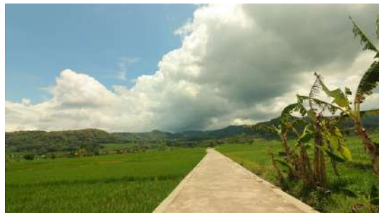
Gambar 5. Jalan sawah kulon progo