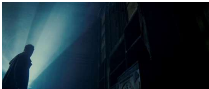
Gambar 15. Tilt “dutch” Angle

Dalam Bahasa studio Hollywood, istilah “Dutch” angle merupakan angle kamera dengan kemiringan gila-gilaan, dimana poros vertical dari kamera membentuk sudut terhadap poros vertical dari subjek. (Mascelli. 2010:78)