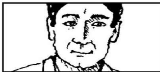
Big Close-Up : BCU

Wajah manusia menempati sebanyak mungkin bingkai dan masih menunjukkan fitur kunci mata, hidung, dan mulut sekaligus Interior atau eksterior . Shot yang intim seperti ini menempatkan penonton secara langsung dalam menghadapi subjek karena setiap detail wajah sangat terlihat, gerakan atau ekspresi wajah harus halus sedikit gerakan kepala dapat ditoleransi sebelum subjek bergerak keluar dari frame . (Christopher 2009:19)