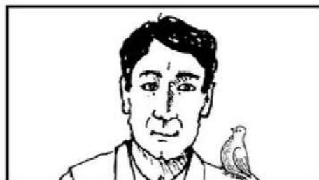
Close-Up : CU

Kadang-kadang disebut “ head shot ,” karena framingdapa memotong bagian atas rambut subjek dan bagian bawah frame dapat mulai di mana saja tepat di bawah dagu atau dengan sedikit bahu atas terlihat.