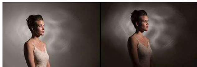
Gambar 32, High Key dan Low Key

Skema pencahayaan yang sangat kontras, tajam atau berlubang, dapat menghasilkan citra yang lebih dramatis atau menegangkan, tetapi juga menghasilkan kedalaman yang lebih dalam pada frame anda. Interaksi cahaya dan bayangan di latar depan, jalan tengah, dan latar belakang shot anda membantu menciptakan efek layering di dalam ruang fisik set yang dalam. Ketidakteraturan objek dalam frame , termasuk wajah dan tubuh manusia, mendapatkan bantuan dari bentuk terang dan gelap ini, yang membantu mereka mencapai tampilan tiga dimensi pada bingkai film dua dimensi. (Christopher 2009:84)