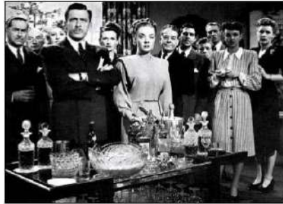
Gambar 10. Angle Kamera Subjektif

sebagai peserta aktif, atau bergantian tempat dengan seseorang pemain dalam film dan menyaksikan kejadian yang berlangsung melalui matanya. Penonton juga dilibatkan dalam film, mana kala seorang pelaku dalam adegan memandang ke lensa yakni karena terjadinya hubungan pemain- penonton melalui pandang – memandang. (Mascelli, 2010:6).