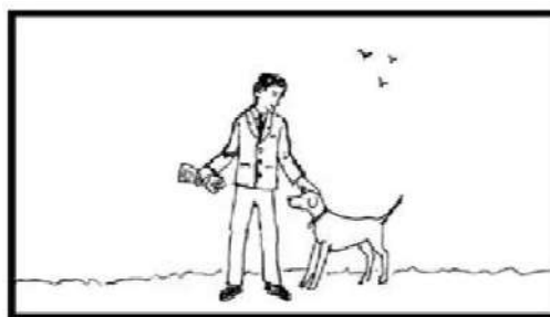
Long Shot : LS

Long Shot (LS) adalah shot yang lebih inklusif. Ini membuat frame lebih banyak kondisi lingkungan di sekitar orang, objek, atau suasana dan sering menunjukkan hubungan mereka di ruang fisik yang jauh lebih baik. Akibatnya, keadaan di sekitar mungkin akan mengambil lebih banyak di frame daripada orang atau objek yang termasuk dalam frame . (Christopher 2009:10).