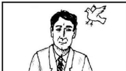
Medium Close-Up : MCU

Kadang-kadang disebut “ two-button ” untuk frame bawah ketat yang dipotong di dada, kira-kira di mana Anda akan melihat dua tombol teratas pada kaos. Dengan pasti memotong di atas sendi siku. Sesuaikan frame bawah sedikit untuk pria atau wanita, tergantung pada kostum mata terlihat jelas, seperti emosi, gaya rambut dan warna, make-up, dll. (Christopher 2009:17)