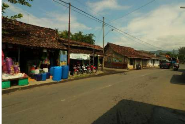
Gambar 6. pasar