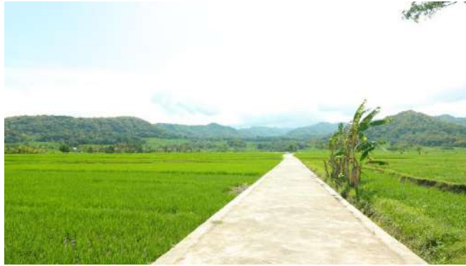
Gambar 4. Sawah kulon Progo