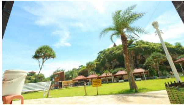
Gambar 1. Pantai ngrawe