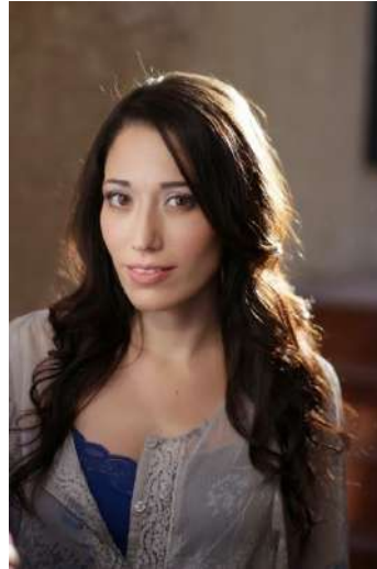
Gambar 29. Kicker / Rim Light

Kicker Ketika cahaya berada di belakang subjek tetapi tidak persis berlawanan dengan lensa kamera, sering disebut kicker atau rimlight , menyoroti tepi rambut, bahu, dan kadang-kadang tulang rahang. (Christopher 2009:89)