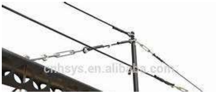
Gambar 2.11 tali baja.