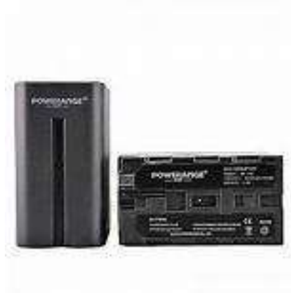
Gambar 2.15 Baterai