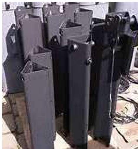
Gambar 2.9 crene