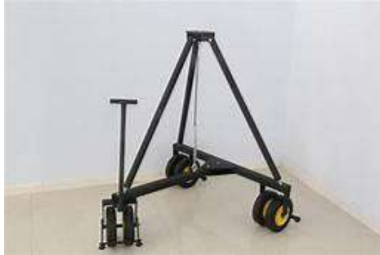
Gambar 2.8 tripod jimmy jib.