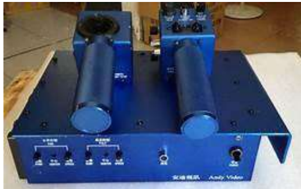
Gambar 2.3. remot atau joy stik.