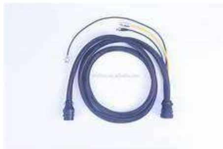
Gambar 2.5.kabel remot.