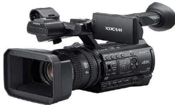
Gambar 2.12 kamera xdcam 100.