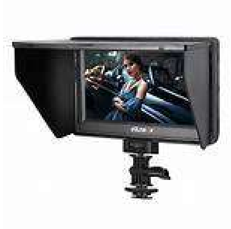
Gambar 2.7 monitor.