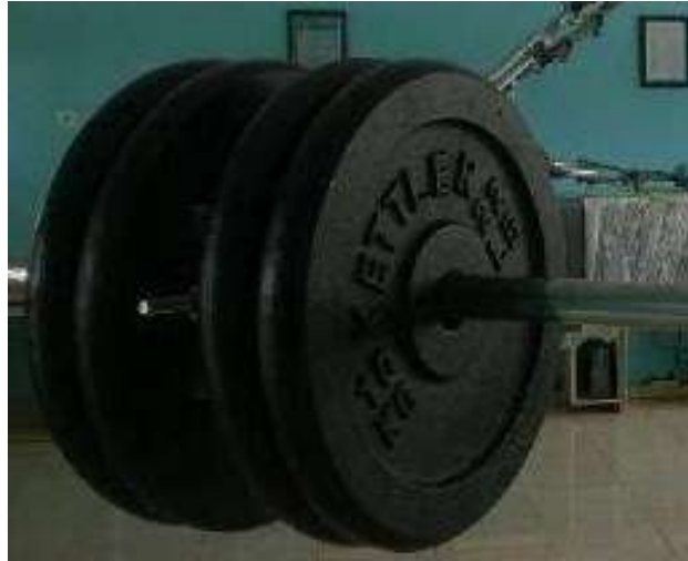
Gambar 2.2. barbel