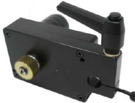
Gambar 2.4. motor control.