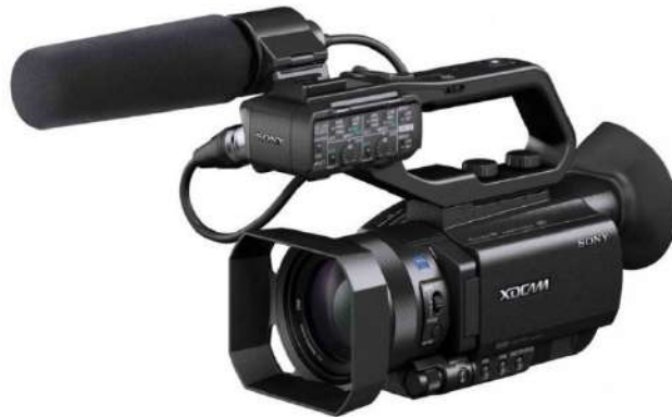
Gambar 2.13 kamera X70