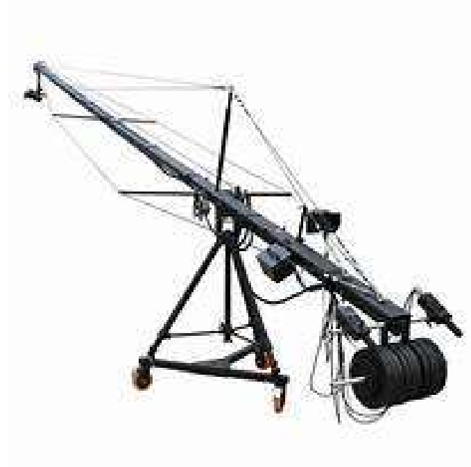
Gambar 2.1 jimmy jib.