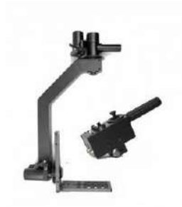
Gambar 2.10 gimbal jimmy jib.