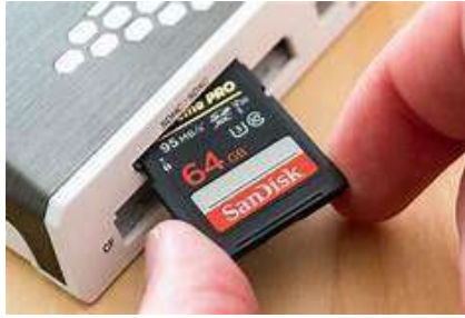
Gambar 2.14 memory