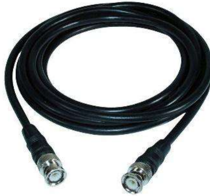
Gambar 2.6. kabel sdi.

kabel ini disambungkan dengan kamera ke monitor supaya kita bisa melihat preview kamera.