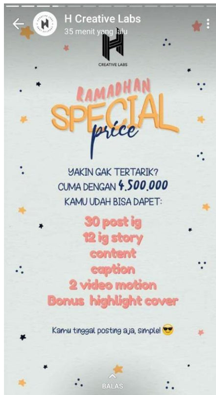
Gambar 36. Pricelist