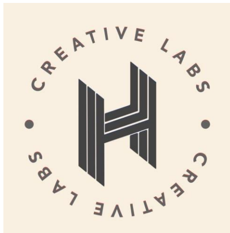
Gambar 31. Logo H Creative Labs

H Creative Labs merupakan Creative Branding dan Design Studio yang menjual Jasa promosi produk dan pembuatan konten instagram. Pendiri H Creative Labs adalah seorang wanita yang memutuskan untuk menjadi ibu rumah tangga. Mencari peluang untuk berpenghasilan dari rumah, bermodalkan laptop & camera dari jaman kuliah yang dipunyainya. Keisengan yang dimulai dari mempelajari software desain seperti adobe, dikarena basic yang dimiliki bukan dari desain grafis melainkan boardcasting . Belajar sendiri lewat bantuan youtube dan teman-teman sekaligus mencari tahu sendiri software editing tersebut sampai akhirnya cukup paham semua isi dan tools-tools yang ada pada adobe. Namun beliau sangat meyakini bahwa Skill tak seberapa tetapi mempunyai taste yang “menjual”. Karena prinsip yang beliau pegang adalah semua orang bisa desain tetapi belum tentu orang itu punya taste yang menjual.