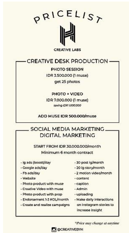
Gambar 35. Pricelist