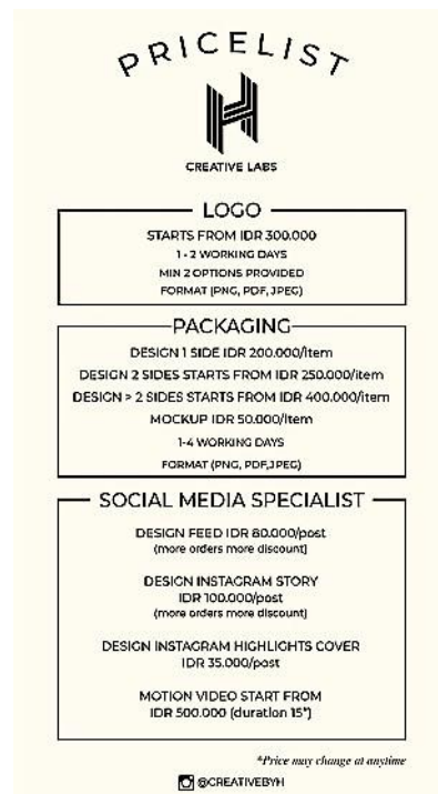
Gambar 32. Pricelist