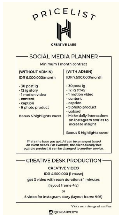
Gambar 34. Pricelist